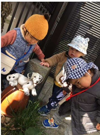
犬の置物にご挨拶しています。

一人がいいものを見つけると、必ず三人が響きあいます。大人にとったら何でもないロープ。けど、一人が笑うとなんか楽しいんです。この気持ちを大切に。だから、今は手をつなぐことは目的ではなく、小さな小道や路地裏を中心に探索散歩を楽しんでいます。置物のワンコ。みんなでご挨拶。これがお約束です。